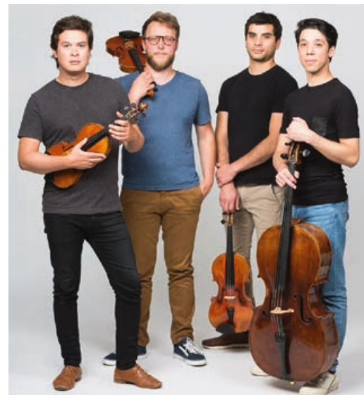
Quatuor Van Kuijk

Dit jaar vieren we het 100-jarige bestaan van de omroep. De Zeister Muziekdagen doen dat met een concert van het avontuurlijke Duitse Schumann Quartett, in een programma met werken die 100 jaar geleden het licht zagen. De werken konden niet verschillender zijn: experiment, individualiteit en onderscheid spelen de boventoon!