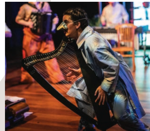
Gong en de vier neuzen

Als 'Rising Stars' presenteren we dit jaar het veelgeprezen Britse Marmen Quartet. Dit jaar bestaat het ensemble tien jaar en dat gaan we vieren: onder andere met de leden van het Viride Kwartet, inmiddels goede bekenden bij de Zeister Muziekdagen. Naast Mozart, Haydn en Beethoven speelt Marmen samen met Viride twee prachtige vroege stukken voor strijkkocet van Sjostakovitsj.